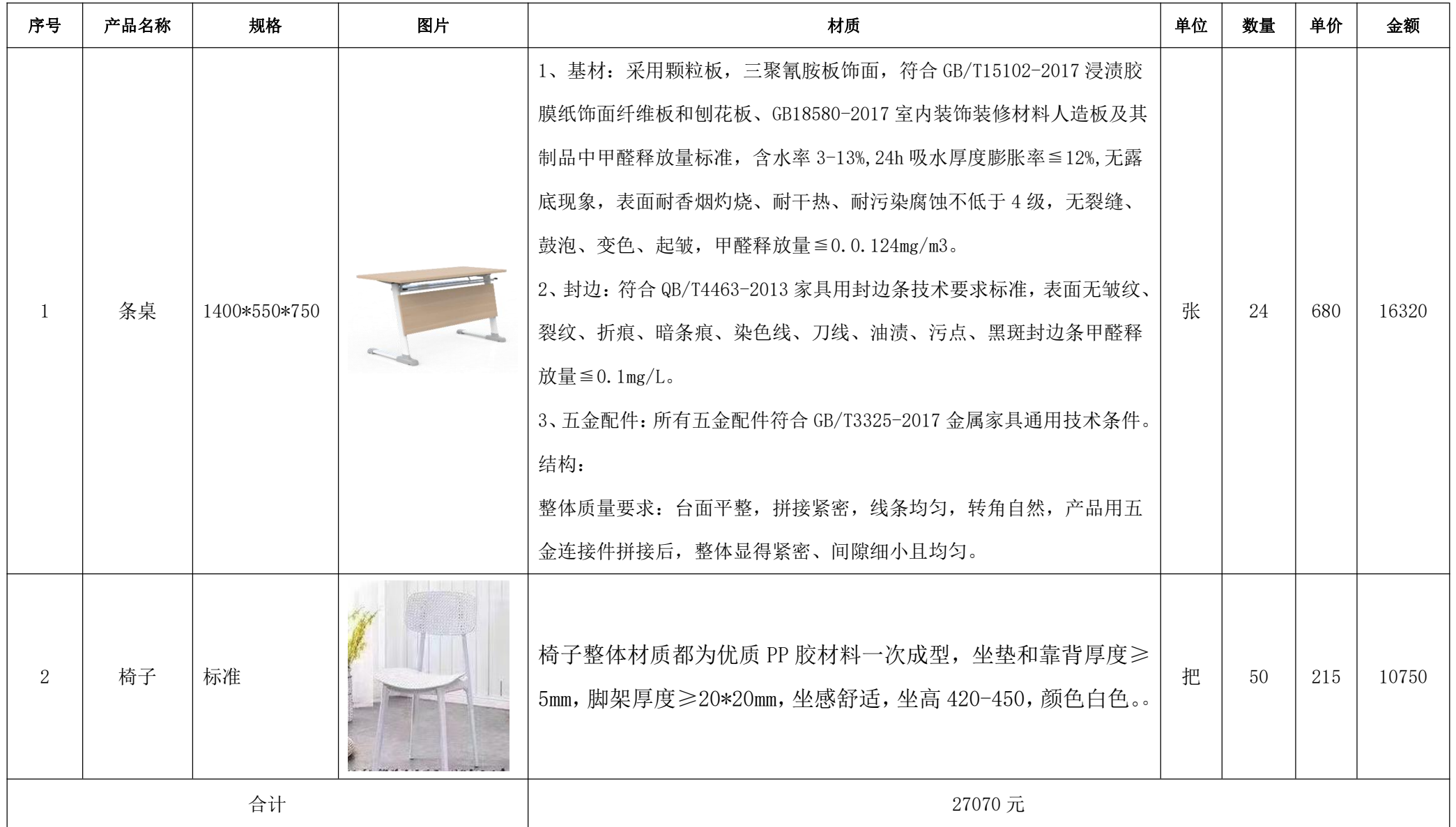
成都市温江区惠民幼儿园锦绣分园多功能厅桌椅采购清单